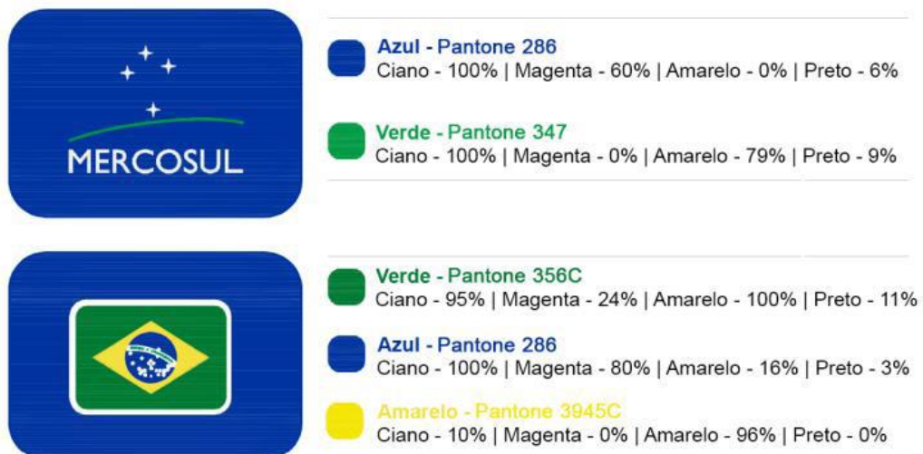
FIGURA IV – MARCAS D'AGUA DE SEGURANÇA DA PELÍCULA RETRORREFLETIVA